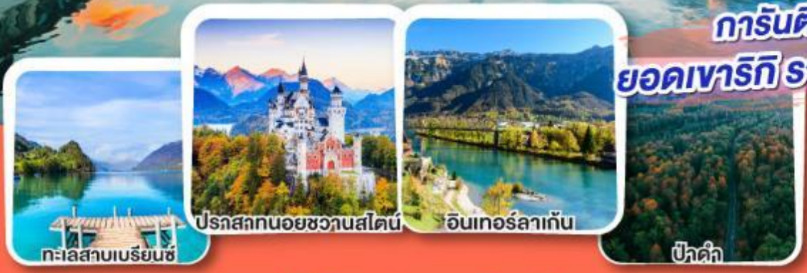
ปราสาทนอยชวานสไตน์