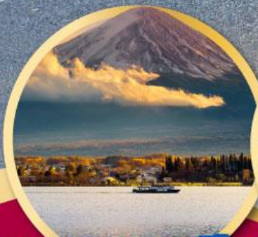
ทะเลสาบคาวากุจิโกะ