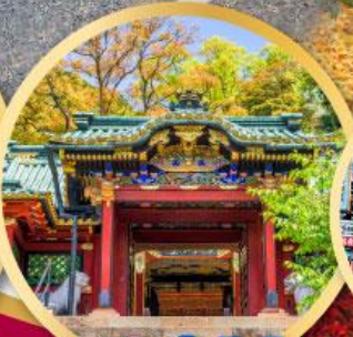
ศาลเจ้าโทโชคุ