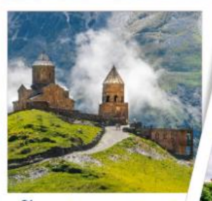
โบสถ์เกอร์เกติ