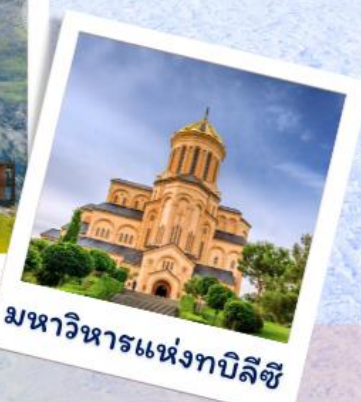
มหาวิหารแห่งทบิลีซี