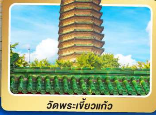
วัดพระเจี๋ยวแก๋ว

เมนูพิเศษ เปิดปักกิ่ง, ชาบูหม้อไฟ อาหารกวางตุ้ง, อาหารเสฉวน