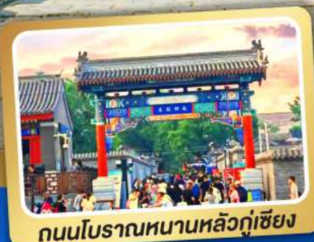
ถนนโบราณหนานหลิวกู่เซียง