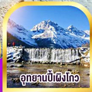
อุทยานป่าเขิงโก