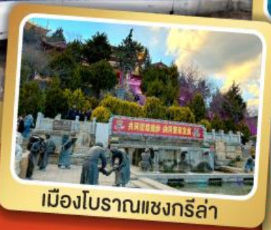
เมืองโบราณแชงกรี่ล่า