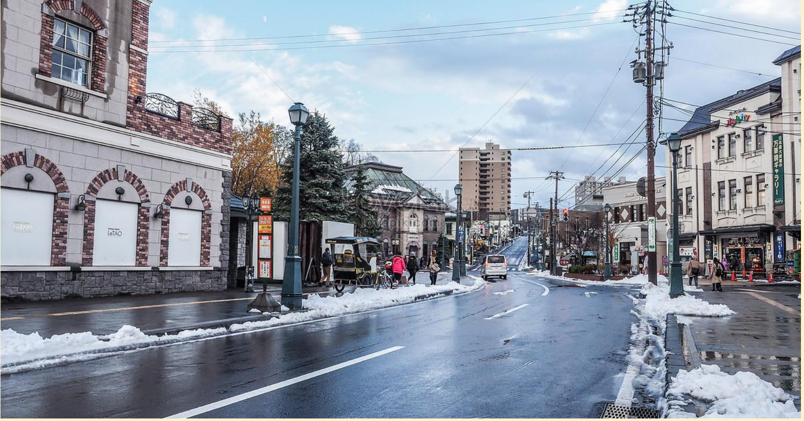
ถนนซาโกมาชิ