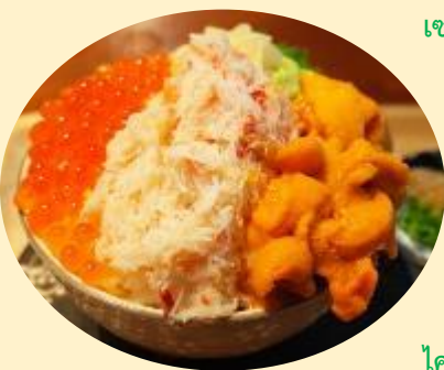
โคเซ็น คิตะมาอะ ฟุนะโมริตั้ง