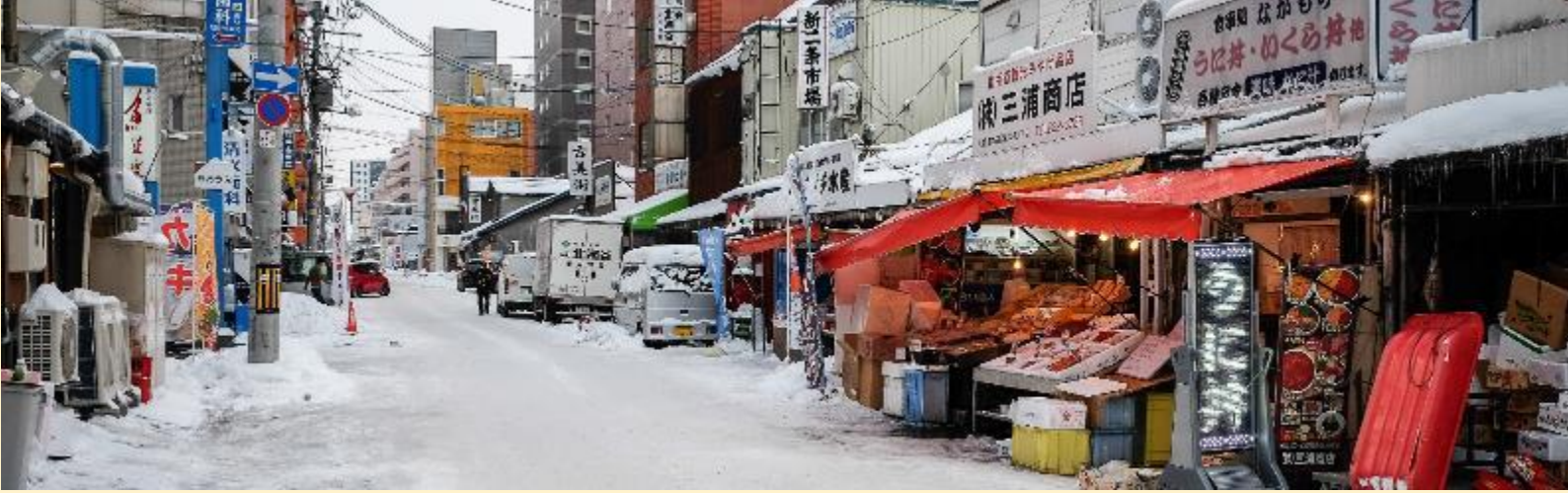
ตลาดซัปโปโรโจไก