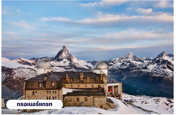
กรอเนอร์เกรน

ถึงเวลาอันสมรนำท่านเดินทางกลับสู่เมืองเซอร์แมทอีกครั้งโดยรถไฟ อิสระ ท่านเดินเล่นชมเมืองเซอร์แมท เลือกซื้อสินค้าของฝากพื้นเมือง หรือนาฬิกาสวิส อันขึ้นชื่อตามอัธยาศัย สมควรแก่เวลานำท่านขึ้นรถไฟกลับสู่เมืองแทสซ์