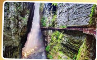
หุบเขารอยแยกอุ่หลิงซาน