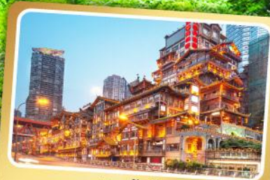
หงหย่าต้ง