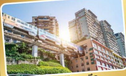
รถไฟฟ้าทะลุตึก