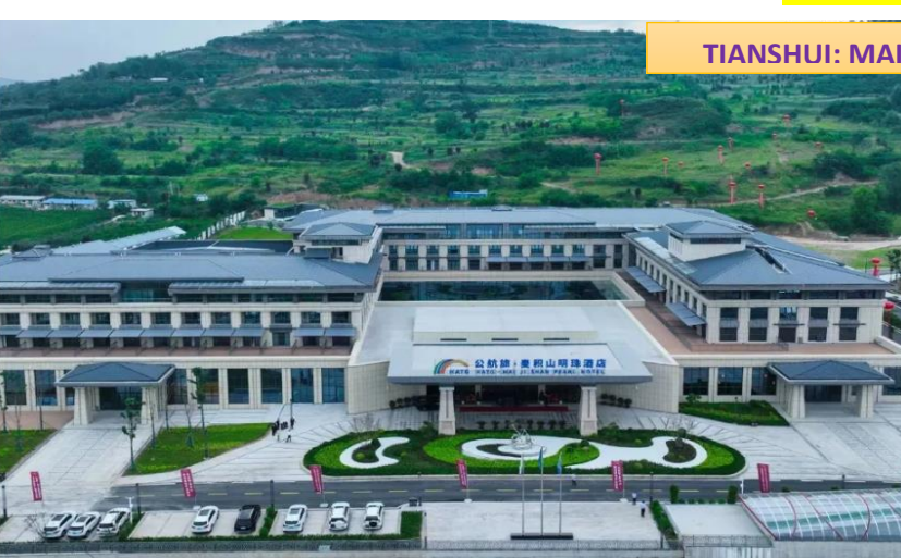
TIANSHUI: MAIJISHAN PEARL HOTEL

ที่พัก MAIJISHAN PEARL HOTEL หรือเทียบเท่า 4 ดาว