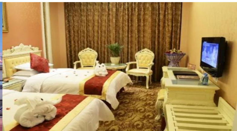
DUNGHUANG: GRAND SUN HOTEL