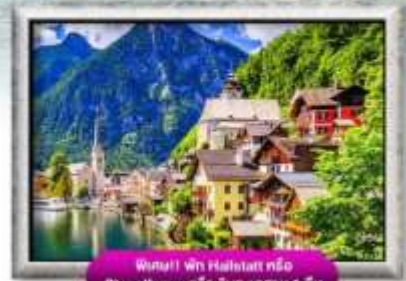
พิกนิกที่หมู่บ้าน Hahntal หรือ St. Wolfgang หรือ Sunnleitaun 1 คืน

พิเศษ!! ลิ้มลองเมนูประจำชาติ ทั้ง 5 ประเทศ!!!