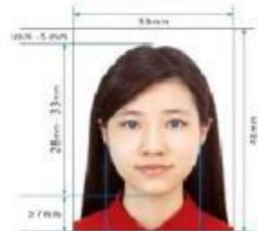
Paper Photo for Visa Application Form