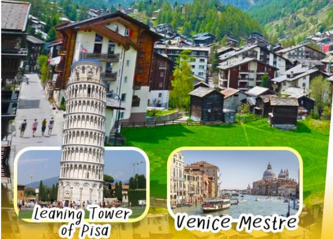
Leaning Tower of Pisa