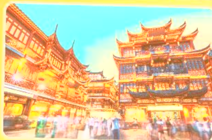
ตลาดร้อยปีเจิ้งหวิงเมี่ยว