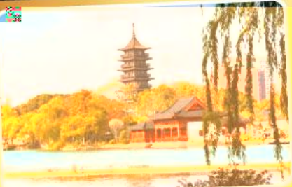
ทะเลสาบหนานหู