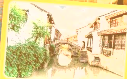
เมืองโบราณเยี่ยเหอ