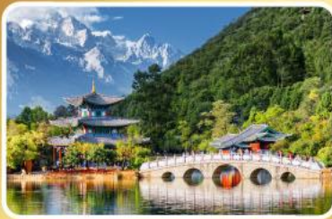
สระน้ำมิงต้า