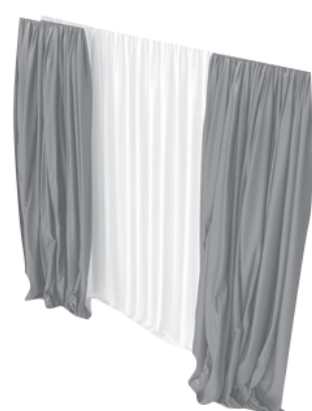
ผ้าม่าน 2 ชุด