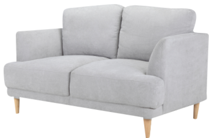
โซฟา 2 ที่นั่ง