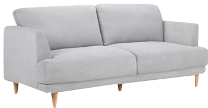
โซฟา 3 ที่นั่ง