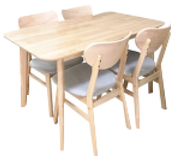
โต๊ะทานอาหาร และเก้าอี้ 4 ตัว