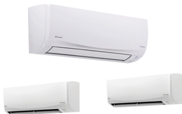
เครื่องปรับอากาศ Inverter 3 เครื่อง

*รับประกันสินค้าและงานติดตั้งโดยผู้ผลิตเท่านั้น **อาจมีการเปลี่ยนแปลงสินค้าในกรณีที่ไม่มีการผลิตรุ่นดังกล่าวเป็นรุ่นเทียบเท่า ***เงื่อนไขเป็นไปตามที่บริษัทกำหนด