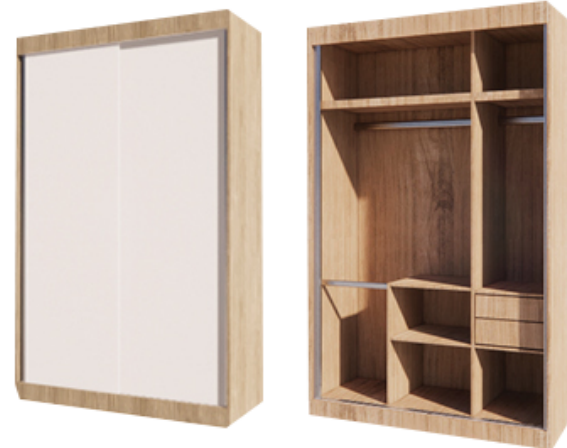
ตู้เสื้อผ้าบานสไลด์