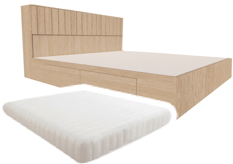
เตียงมีลื่นชักพร้อมที่นอน