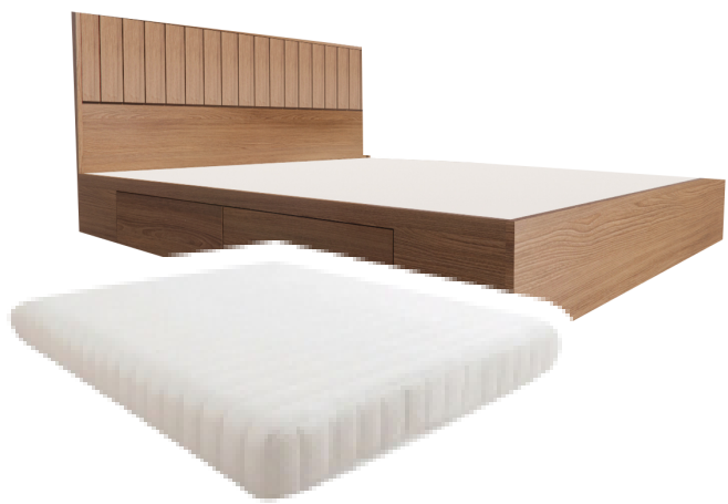
เตียงมีลิ้นชักพร้อมที่นอน