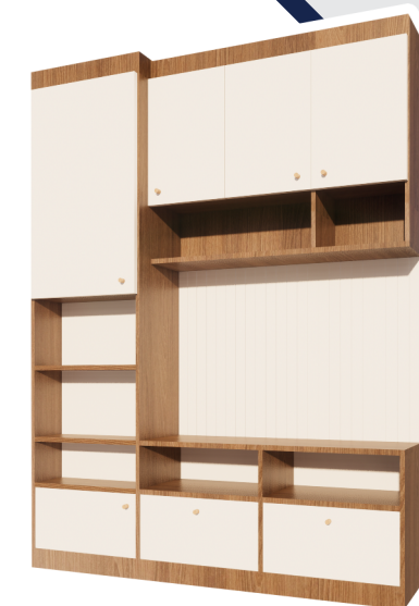
ตู้วางทีวี