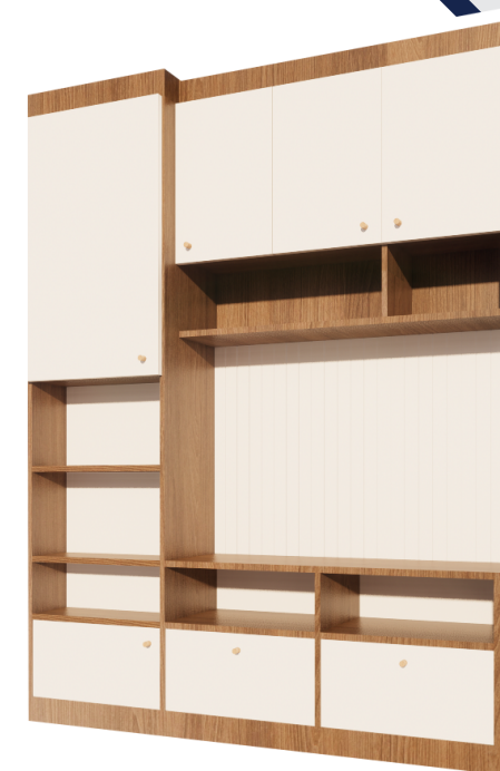
ตู้วางทีวี