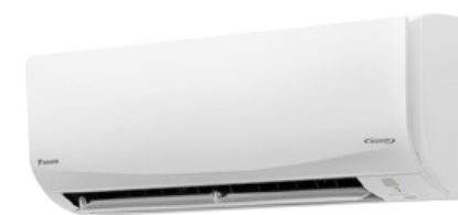
เครื่องปรับอากาศ Inverter 1 เครื่อง

*รับประกันสินค้าและงานติดตั้งโดยผู้ผลิตเท่านั้น **อาจมีการเปลี่ยนแปลงสินค้าในกรณีที่ไม่มีการผลิตรุ่นดังกล่าวเป็นรุ่นเทียบเท่า ***เงื่อนไขเป็นไปตามที่บริษัทกำหนด