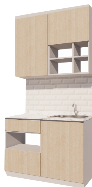
ชุดเคาน์เตอร์ครัว พร้อมตู้ลอย