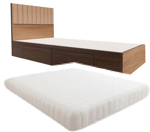
เตียงมีลิ้นชักพร้อมที่นอน