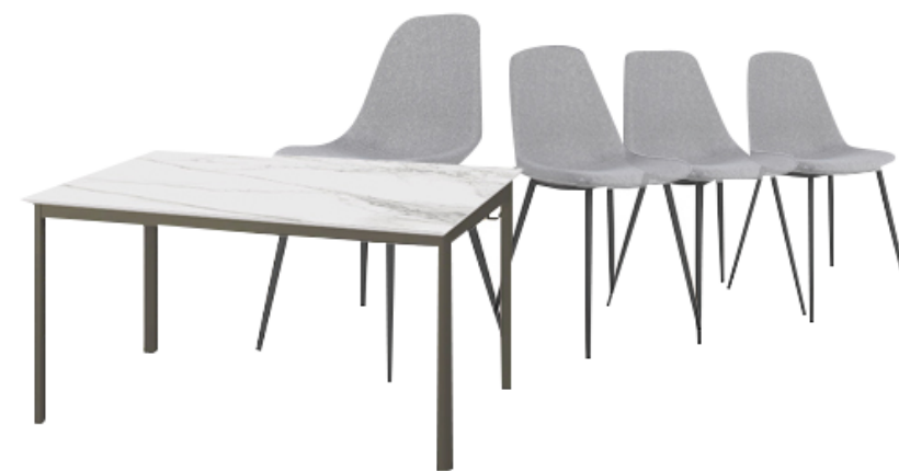
โต๊ะทานอาหาร และเก้าอี้ 4 ตัว