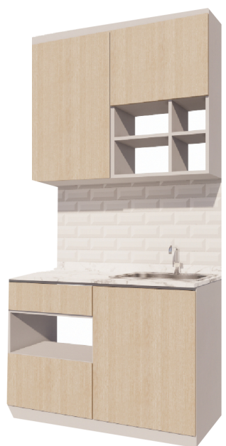
ชุดเคาน์เตอร์ครัว พร้อมตู้ลอย