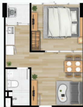
● 34 ตร.ม.