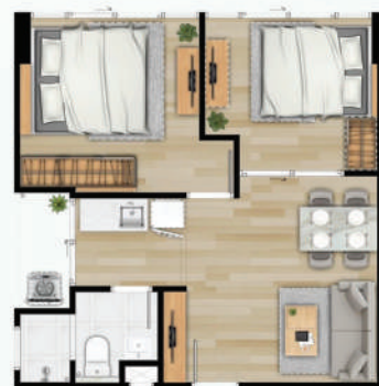
● 43 ตร.ม.