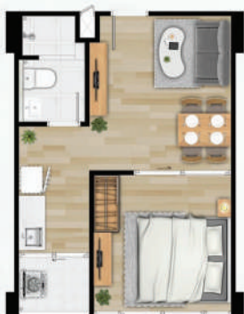
● 32.5 ตร.ม.