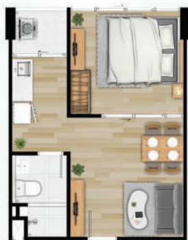
● 33.5 ตร.ม.