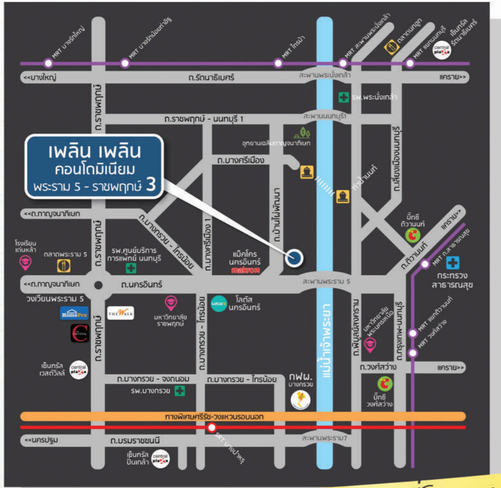
แผนที่โครงการ