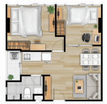
● 43 ตร.ม.