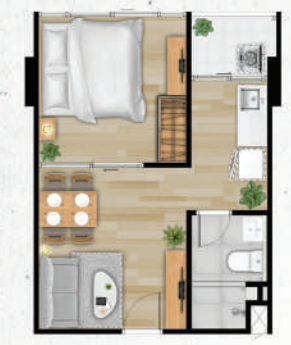
● 32.5 ตร.ม.

● 32.5 ตร.ม. ● 33 ตร.ม. ● 33.5 ตร.ม. ● 34.5 ตร.ม. ● 43 ตร.ม. ● 43.5 ตร.ม.