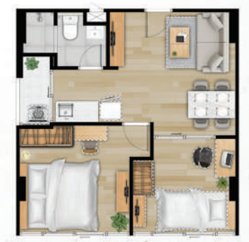
● 43.5 ตร.ม.