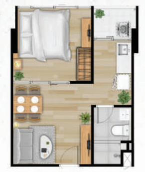
● 33 ตร.ม.