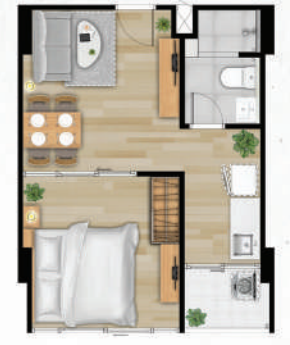
● 33.5 ตร.ม.