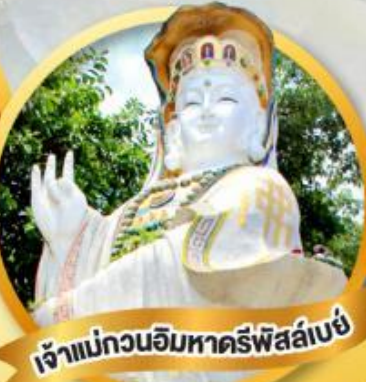
เจ้าแม่กวนอิมหาดรีพีส์ลีย์