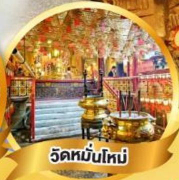
วัดหมื่นโหม่