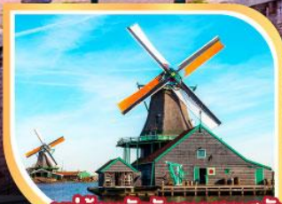
หมู่บ้านกังหันลมชาวนสคันส์