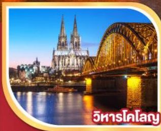
วิหารโคโลญ

25 ม.ค.-01 ก.พ. 68 01-08, 08-15, 15-22 ก.พ. 68 22 ก.พ.-01 มี.ค. 68 01-08 มี.ค. 68