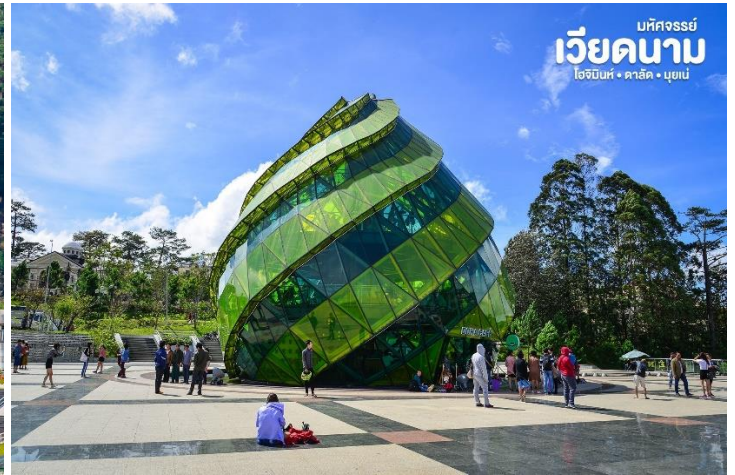
เวียดนาม โฮจิมินห์ • ดาลัด • มุยเน่

จากนั้น นำท่าน นั่งกระเช้าไฟฟ้า ชมวิวทิวทัศน์เมืองดาลัดจากมุมสูงและนำท่านไหว้พระที่ วัดตัก lám (Truc Lam) วัดพุทธในนิกายเซน (ZEN) แบบญี่ปุ่น ภายในวัดตกแต่งสวยงามด้วยสวนดอกไม้