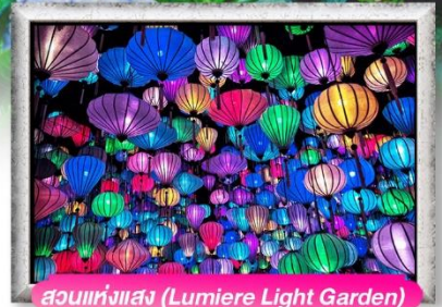
สวนแห่งแสง (Lumiere Light Garden)

เมนู สุดพิเศษ อร่อยไปกับ BBQ / ซิมไวน์แดงดาลัด