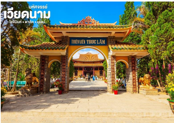
เวียดนาม โฮจิมินห์ • ดาลัด • มุยเน่

จากนั้น นำท่าน นั่งกระเช้าไฟฟ้า ชมวิวทิวทัศน์เมืองดาลัดจากมุมสูงและนำท่านไหว้พระที่ วัดตัก lám (Truc Lam) วัดพุทธในนิกายเซน (ZEN) แบบญี่ปุ่น ภายในวัดตกแต่งสวยงามด้วยสวนดอกไม้