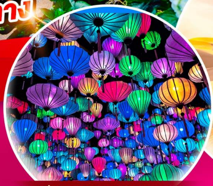
สวนแห่งแสง (Lumiere Light Garden)