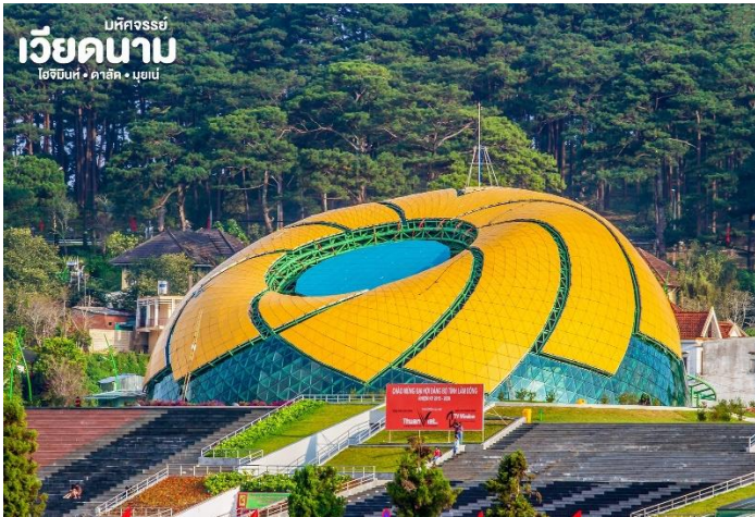
เวียดนาม โฮจิมินห์ • ดาลัด • มุยเน่