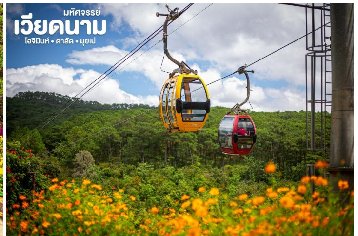
เวียดนาม โฮจิมินห์ • ดาลัด • มุยเน่

ค่ำ ๗ บริการอาหารค่ำ แบบ BBQ BUFFET เสริฟ พร้อม ไวน์แดงดาลัด