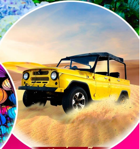
ฟรี! นิ่งรถจี๊ป