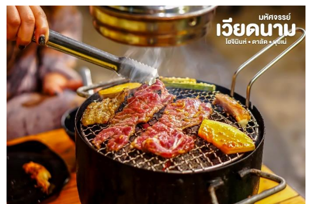
เวียดนาม โฮจิมินห์ • ดาลัด • มุยเน่

หลังอาหารนำท่าน ช้อปปิ้งตลาดไนท์บาร์ซ่า ให้ท่านได้เลือกซื้อสินค้านานาชนิด อาทิ ดอกไม้, เสื้อกันหนาว, ผลไม้ฤดูหนาวทั้งสดและแห้ง, ผักนานาชนิด, ขนมพื้นเมือง, กาแฟและชา เป็นต้น