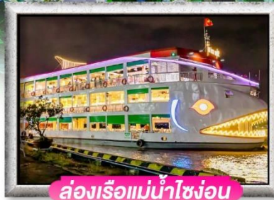
ล่องเรือแม่น้ำไซง่อน