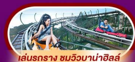
เล่นรถราง ชมวิวบานาฮิลล์