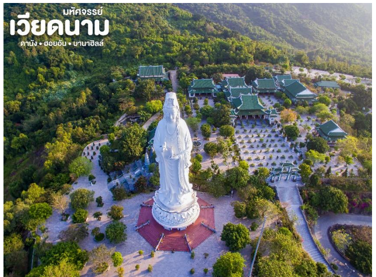
บทกวี เวียดนาม ดานัง • ฮอยอัน • บานาฮิลล์

จากนั้น สักการะ วัดลินห์อิ่ง (Linh Ung) เป็นวัดที่ใหญ่ที่สุดของเมืองดานังภายในวิหารใหญ่ของวัดเป็นสถานที่บูชาเจ้าแม่กวนอิมและเทพองค์ต่างๆตามความเชื่อของชาวบ้านแถบนี้ นอกจากนี้ยังมีรูปปั้นปูนขาวเจ้าแม่กวนอิมซึ่งมีความสูงถึง 67 เมตร ตั้งอยู่บนฐานดอกบัวกว้าง 35 เมตร ยืนหันหลังให้ภูเขาและหันหน้าออกทะเลคอยปกป้องคุ้มครองชาวประมงที่ออกไปหาปลา นอกชายฝั่งวัดแห่งนี้นอกจากเป็นสถานที่ศักดิ์สิทธิ์ที่ชาวบ้านมากราบไหว้บูชาและขอพรแล้วยังเป็นอีกหนึ่งสถานที่ท่องเที่ยวที่สวยงามเป็นอีกหนึ่งจุดชมวิวที่สวยงามของเมืองดานัง