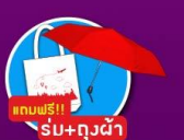
แถมฟรี!! ร่ม+ถุงผ้า