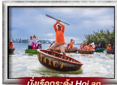
นั่งเรือกระดัง Hoi an