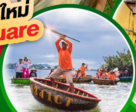
นั่งเรือกระดัง Hoi an