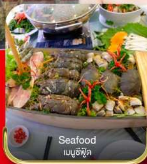
Seafood เมนูซีฟู้ด