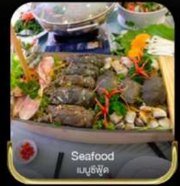
Seafood บุฟเฟ่ต์