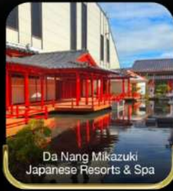
Da Nang Mikazuki Japanese Resorts & Spa