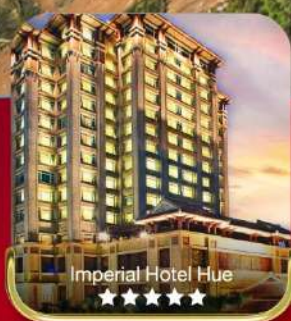
Imperial Hotel Hue ★★★★★