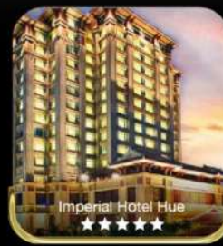
Imperial Hotel Hue ★★★★★