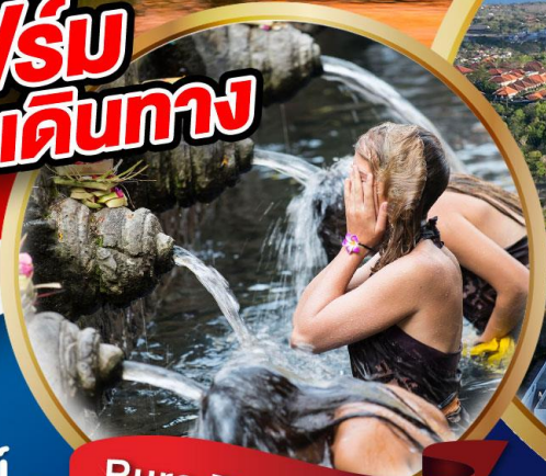
Pura Tirta Empul