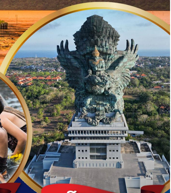
สวนวิษณุ