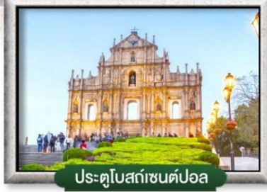
ประตูโบสถ์เซนต์ปอล