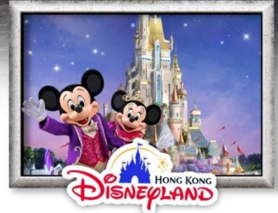
HONG KONG Disneyland

ชมการแสดง แสง สี เสียง Symphony of Lights