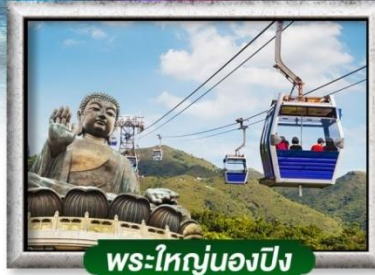
พระใหญ่นองปิง