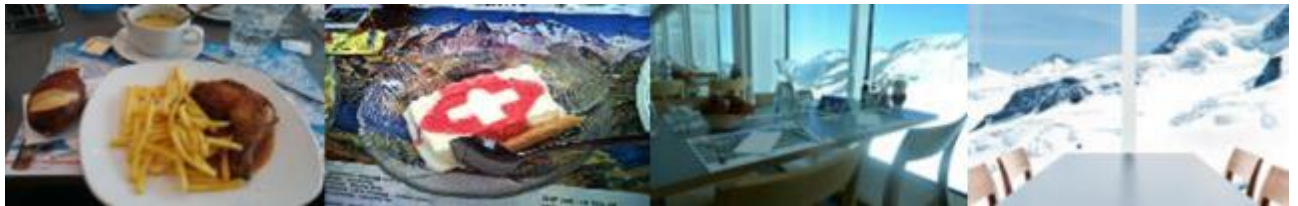
เที่ยง 📍 รับประทานอาหารกลางวัน ณ ภัตตาคาร บนยอดเขาจุงเฟรา (มือที่ 16)