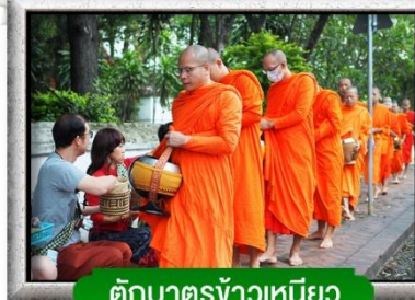
ตักบาตรข้าวเหนียว