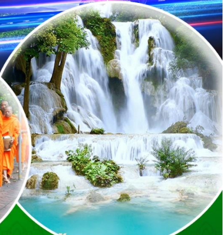
ดักบาตรข้าวเหนียว