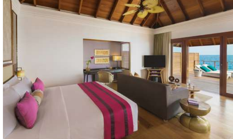
Water Villa with Pool