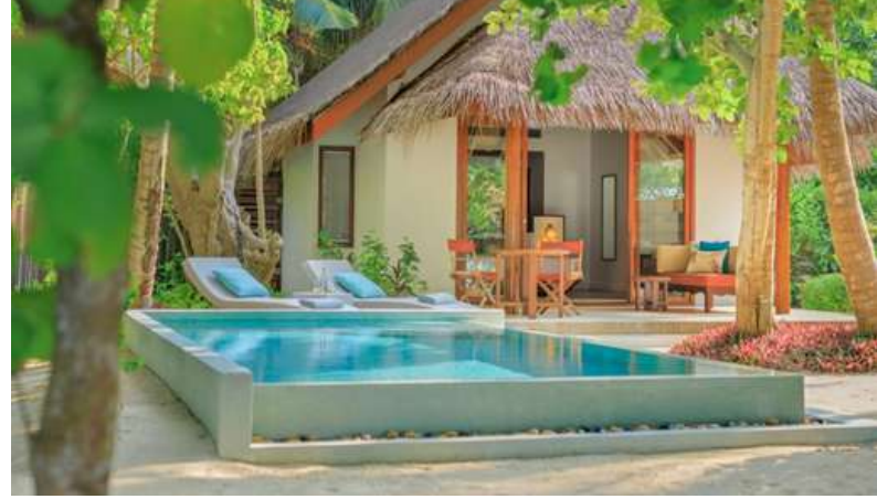
Deluxe Beach Villa with Pool