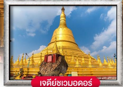
เจดีย์ชเวดออดอร์

เมนู สุดพิเศษ | กุ้งแม่น้ำเผา + บุฟเฟ่ต์นานาชาติ