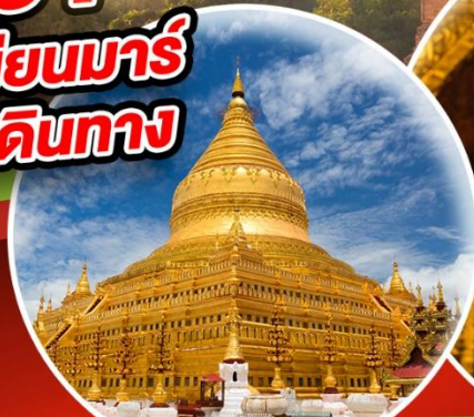
วัดเจติยเขวลีทอง