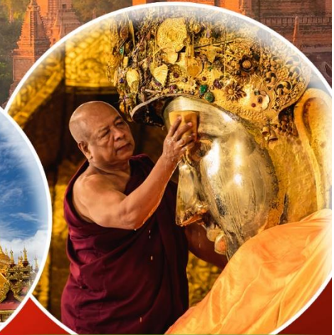
พิธีล้างหน้าพระพักตร์พระมหาบุญมี

ฟรี วีซ่า รวมประกันเมียนมาร์ 15 ล้านออกเดินทาง