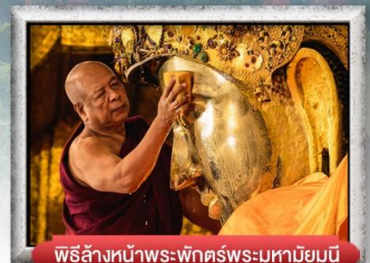
พิธีล้างหน้าพระพักตร์พระมหาเมียนุณี