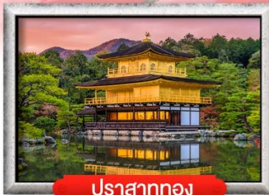
ปราสาททอง