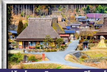
หมู่บ้านโบราณมียามะ- คายาบูกิโนะซาโตะ