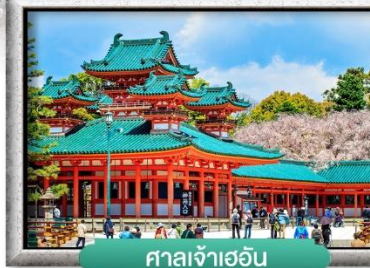
ศาลเจ้าเฮอัน