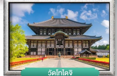
วัดโทไดจิ