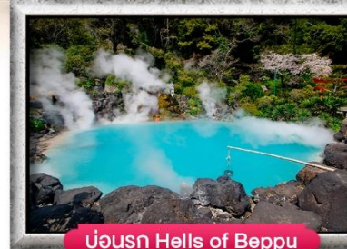
บ่อน้ำ Hells of Beppu

พิเศษ! บุฟเฟ่ต์บั้งย่างยากิินิกุ, บุฟเฟ่ต์ชาบู