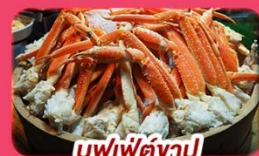
บุฟเฟ่ต์งาปู