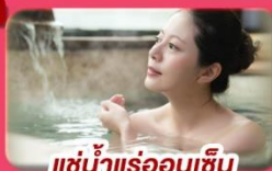
แช่น้ำแร่ร้อนเซ็น