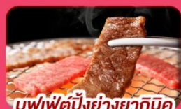
บุฟเฟ่ต์บิงย่างยากินิกุ