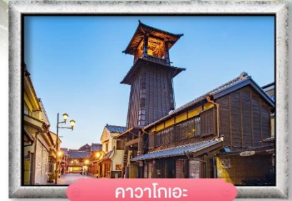
คาวาโกเอะ: