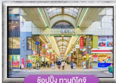
ซัปโปโปะ ทานุกิโคจิ