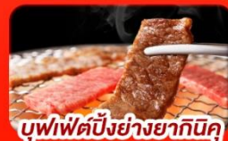
บุฟเฟ่ต์ปิ้งย่างยากินุ