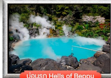
บ่อน้ำ Hells of Beppu