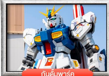
กันดั้มพาร์ค