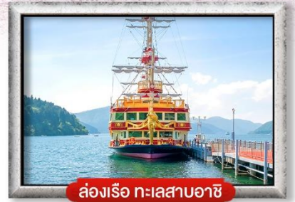
ล่องเรือ ทะเลสาบอาชิ