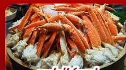
ซูฟเฟ้ดงาปู