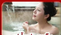
แช่น้ำแร่ร้อนเซ็น