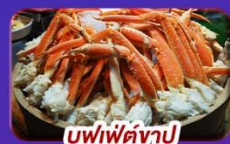
ซูฟิ่ตังปู