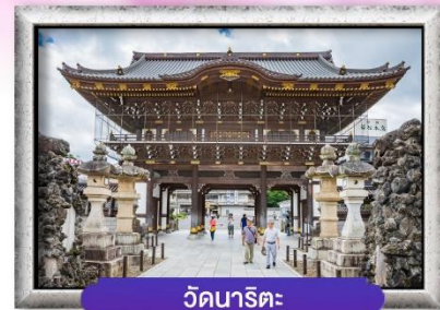
วัดนาริตะ