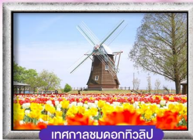
เทศกาลชมดอกทิวลิป