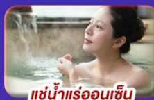
แช่น้ำร้อนเซน