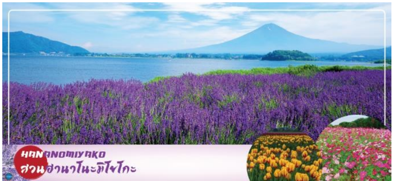
HANANOMIYAKO สวนसानะโนะมียาโกะ

วันที่สอง ท่าอากาศยานนานาชาตินาริตะ – เมืองยามานาชิ – สวนดอกไม้सानะโนะมียาโกะ หรือ เทศกาลชมดอกลาเวนเดอร์ที่ทะเลสาบคาวากุจิ (ตามฤดูกาล) – หมู่บ้านโอชิโนะซึกไก – ออนเซ็น + ชาบูยักษ์