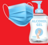
แจกแมส, เจล