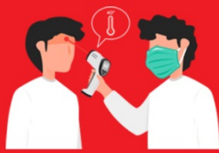
วัดไข้ผู้เดินทาง