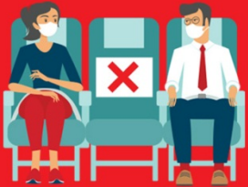
สายการบิน