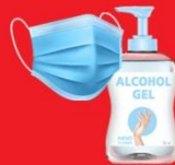
แจกแมส, เจล