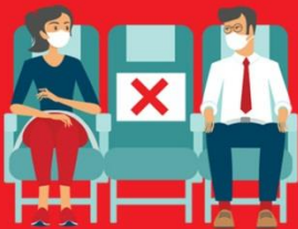
สายการบิน