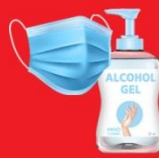
แจกแมส, เจล