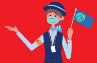
ไกด์ใส่แมสตลอดเวลา