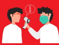
วัดไข้ผู้เดินทาง