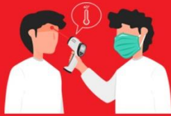
วัดไข้ผู้เดินทาง