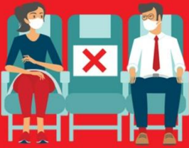
สายการบิน