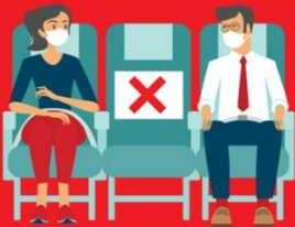
สายการบิน