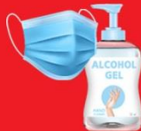
แจกแมส, เจล