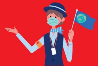
ไกด์ใส่แมสตลอดเวลา

สายเที่ยว โทรด่วน เปิดให้บริการตลอด 24 ชั่วโมง ทุกวันไม่เว้นวันหยุดราชการ สามารถฝากข้อความไว้ในไลน์ บอท