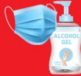
แจกแมส, เจล