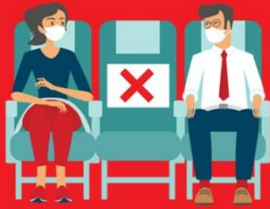
สายการบิน