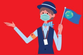
ไกด์ใส่แมสตลอดเวลา