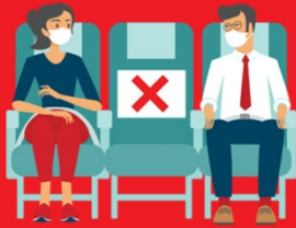
สายการบิน