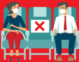
สายการบิน