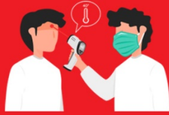
วัดไข้ผู้เดินทาง