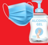
แจกแมส, เจล