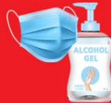
แจกแมส, เจล