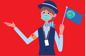
ไกด์ใส่แมสตลอดเวลา