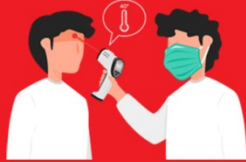
วัดไข้ผู้เดินทาง