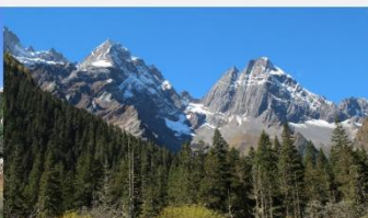
กุหลาบสดรุณี (หุบเขาชวงเฉียวโกว)