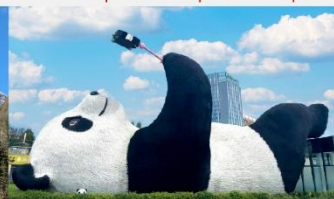
รูปปั้นหมีแพนด้าบนเซลฟี