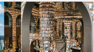
ร้านหนังสือชู่เก๋อ

*ทางบริษัทฯ ขอสงวนสิทธิ์ในการสลับโปรแกรมทัวร์ตามความเหมาะสมขึ้นอยู่กับสถานการณ์หน้างาน โดยคำนึงถึงผลประโยชน์ของลูกค้าเป็นสำคัญ