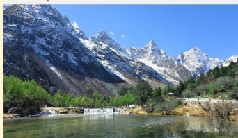
อุทยานแห่งชาติปักกิ่งโกว