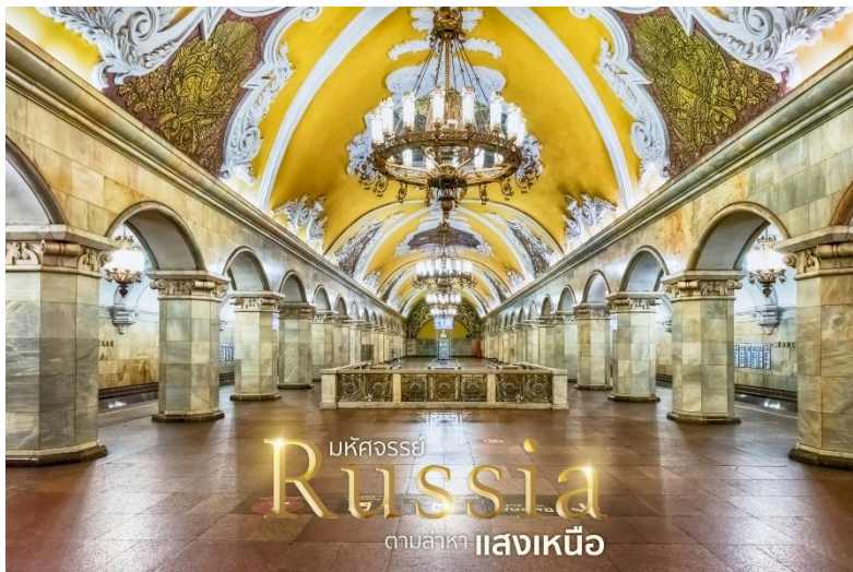
มหัตถรรย Russia ตามล้าหา แสงเหนือ

12.25 น. ถึง เมืองมอสโก เดินทางสู่ สถานีรถไฟใต้ดินกรุงมอสโก(Moscow Metro) ตื่นตากับการผสมผสานระหว่างเทคโนโลยีกับสถาปัตยกรรมหลากหลายรูปแบบ เช่นการประดับด้วยกระจกสี หินอ่อนเป็นต้น นำท่านเดินทางไปยัง ถนนคนเดิน ถนนอาร์บัต(Arbat Street) ที่ตั้งอยู่ในใจกลางของแหล่งประวัติศาสตร์ และถือว่าเป็นหนึ่งในย่านโบราณที่สุดของมอสโก ที่มีชื่อปรากฏในประวัติศาสตร์มาตั้งแต่ศตวรรษที่ 15 โดยตลอดความยาว 1.8 กิโลเมตร ที่เต็มไปด้วยร้านอาหาร ร้านขายของที่ระลึก ร้านกาแฟ และยังเป็นแหล่งชุมนุมของศิลปินอินดี้ ที่มาโชว์ฝีมือกันจัดแบบไม่มีใครขอมใคร